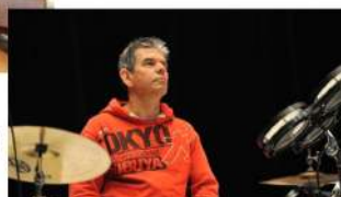
MICHEL DELTRUC